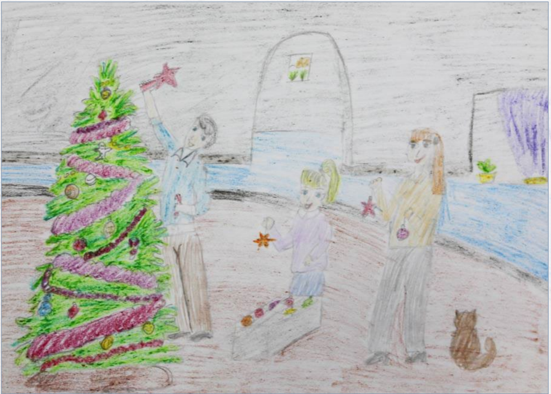
Дьяченко Светлана, 6 лет. «Семейный очаг»