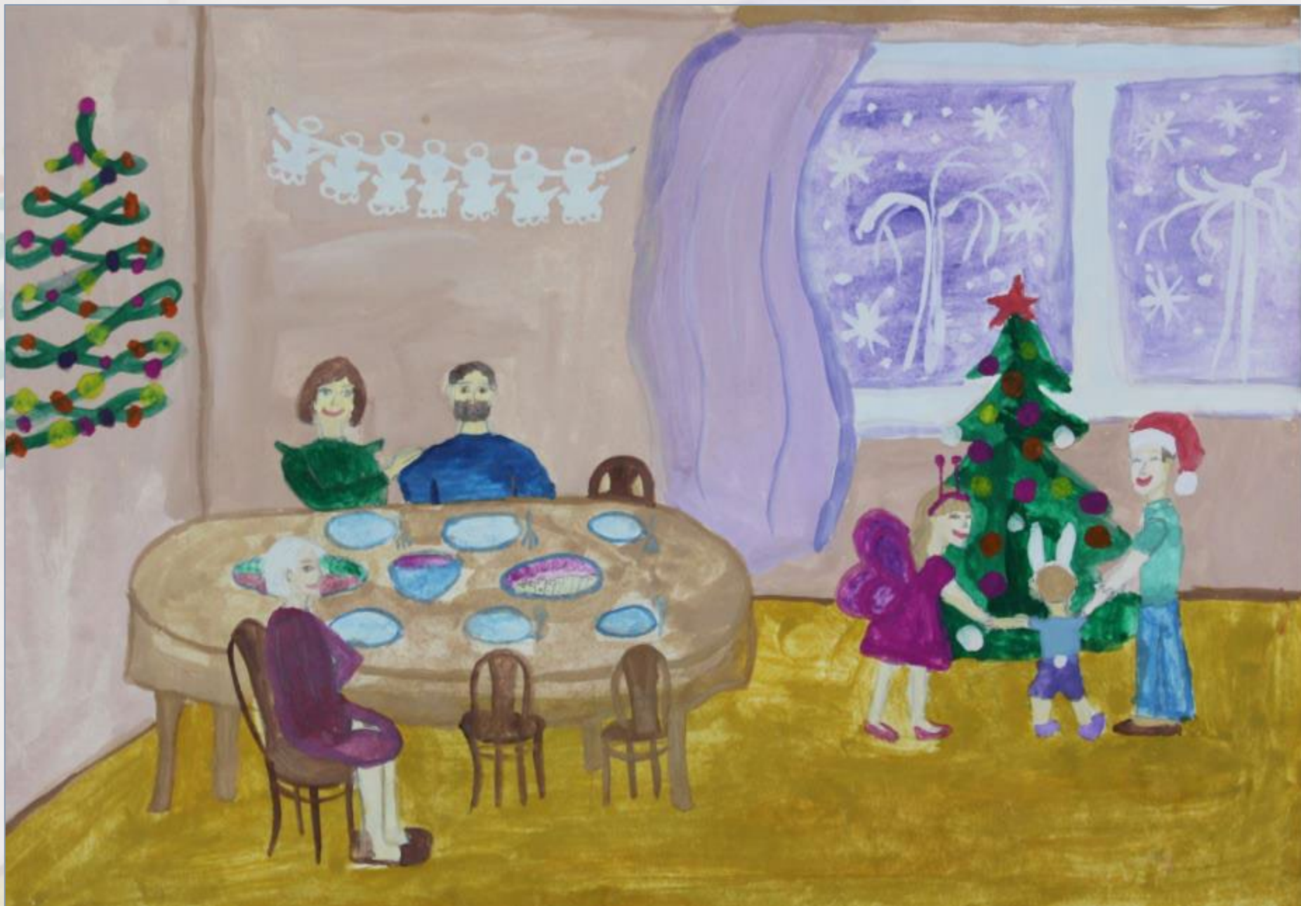
Смирнов Даниил, 9 лет. «Семейный праздник “Рождество”»