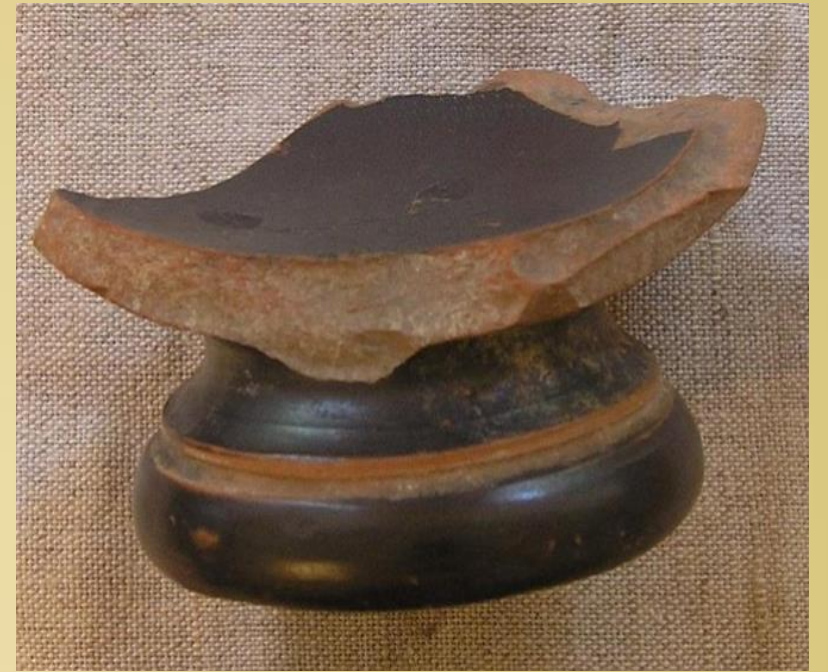
Раскопки в Крыму 1898 г.