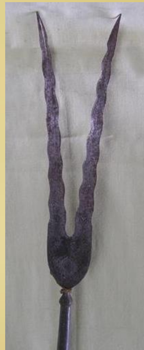
Многозубцы церемониальные XVIII в. Место приобретения - Кавказ