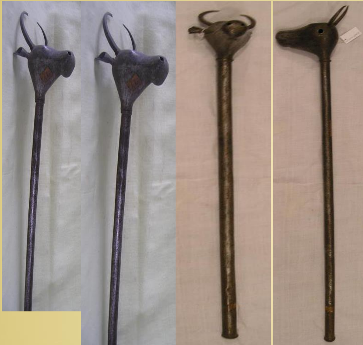
Булавы с навершием головы быка и головы дэва.