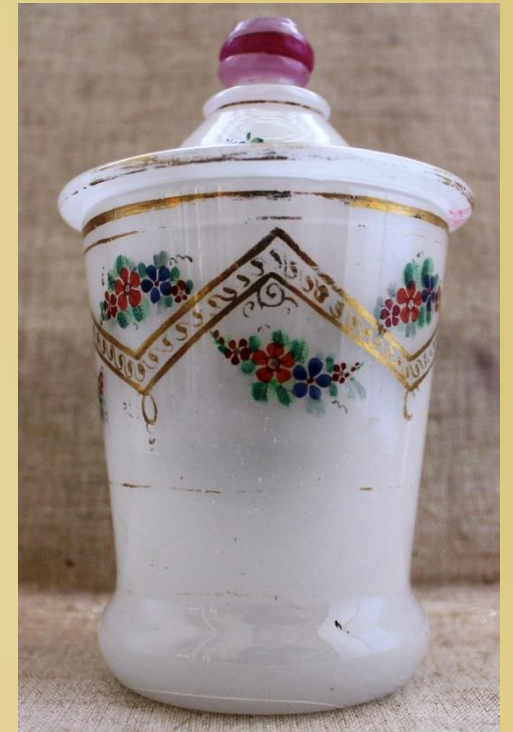
Сдано в музей К.Н. Евреиновым в 1904 г.