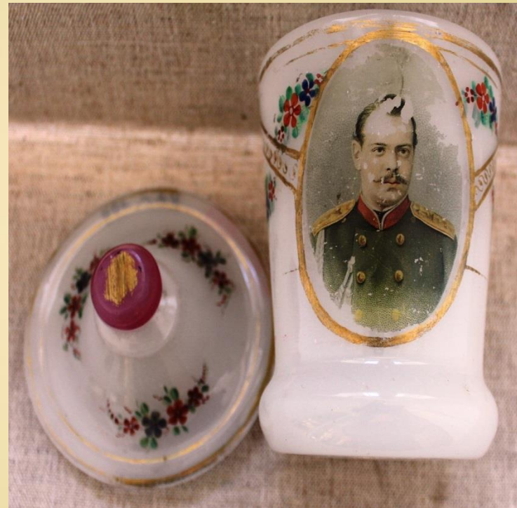
Сахарница с погрудным изображением цесаревича, будущим императором Александром III