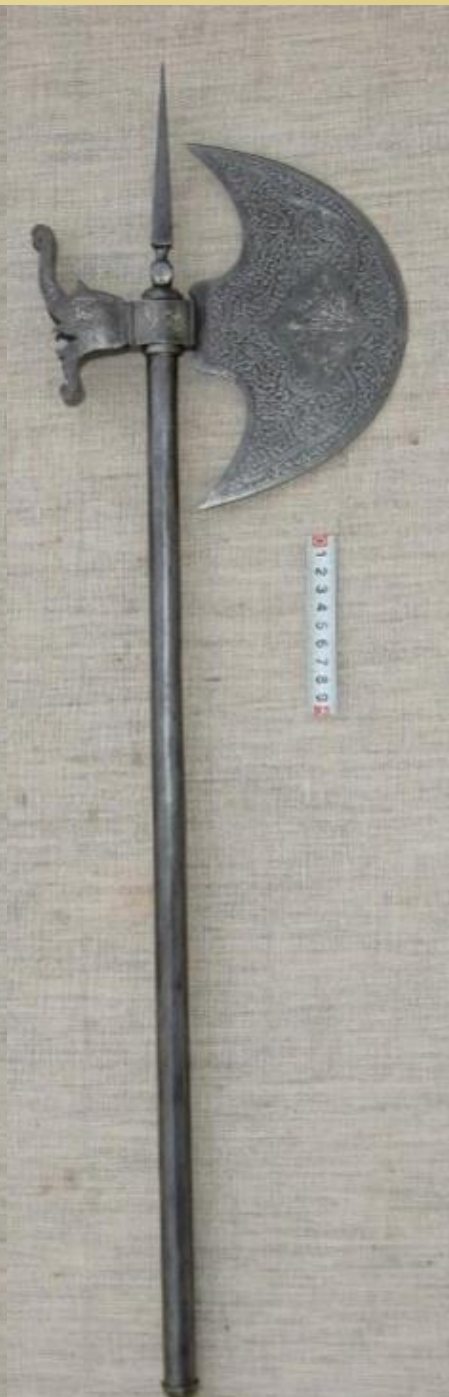
Шопоры восточные XVIII в. УТИАХМ