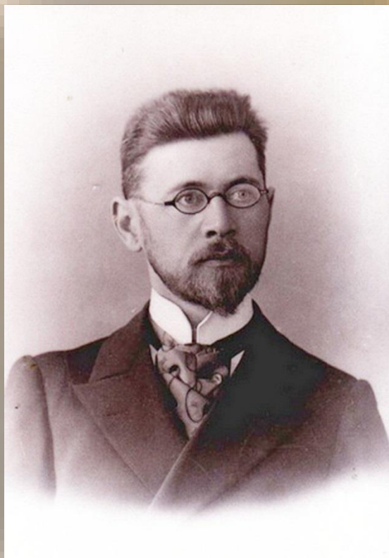
Михаил Павлович Чехов (1865 — 1936)