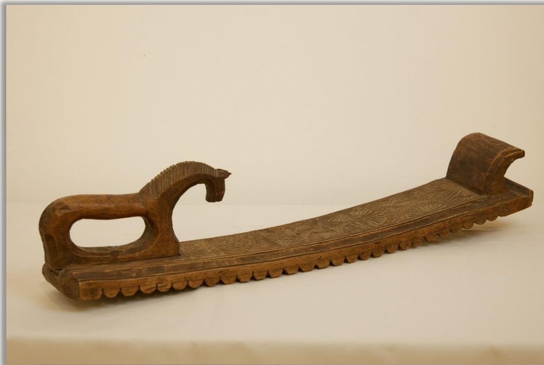
Рубель 1875 г. Угличский уезд Дерево. Резьба