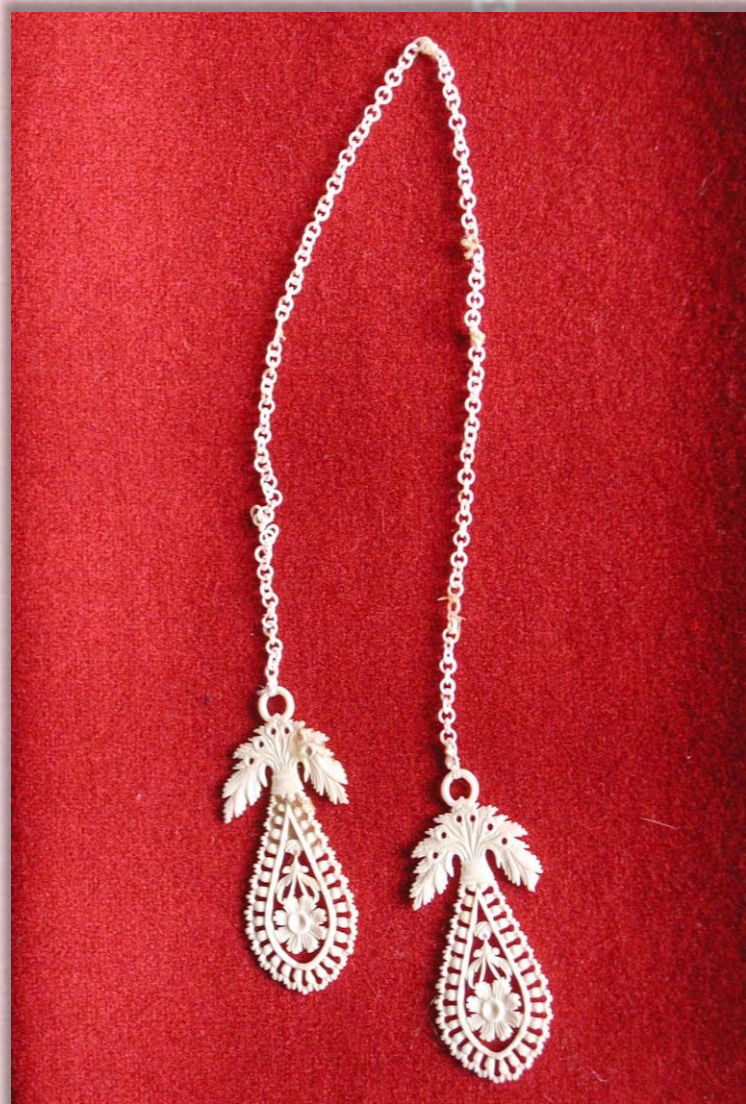
Ожерелье XIX в. Поморье Кость. Резьба по кости