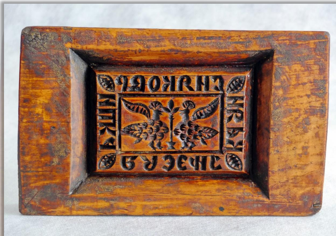
Форма для пряника XIX в. Дерево. Резьба