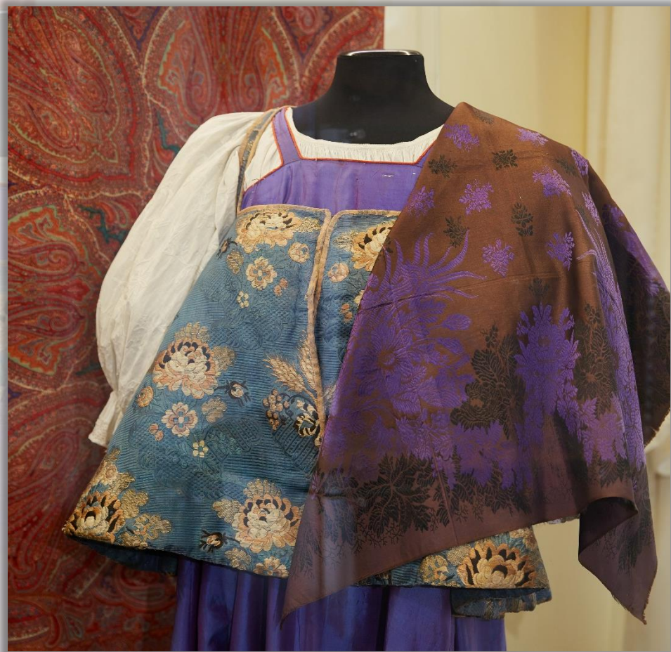
Душегрея XVIII в. Шёлк, крашенина. Крой, шитьё

В разных уездах Ярославской губернии бытовали душегреи, сшитые из парчи, узорного шёлка, крашенины.