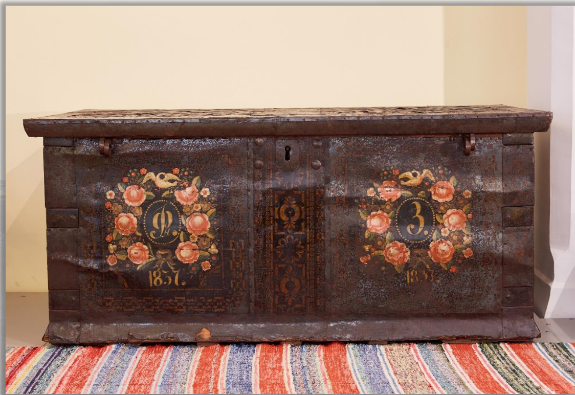
Сундук 1837 г. Дерево, металл

Сундуки были предметом первой необходимости древнерусского интерьера, а в деревнях бытовали вплоть до XX века.