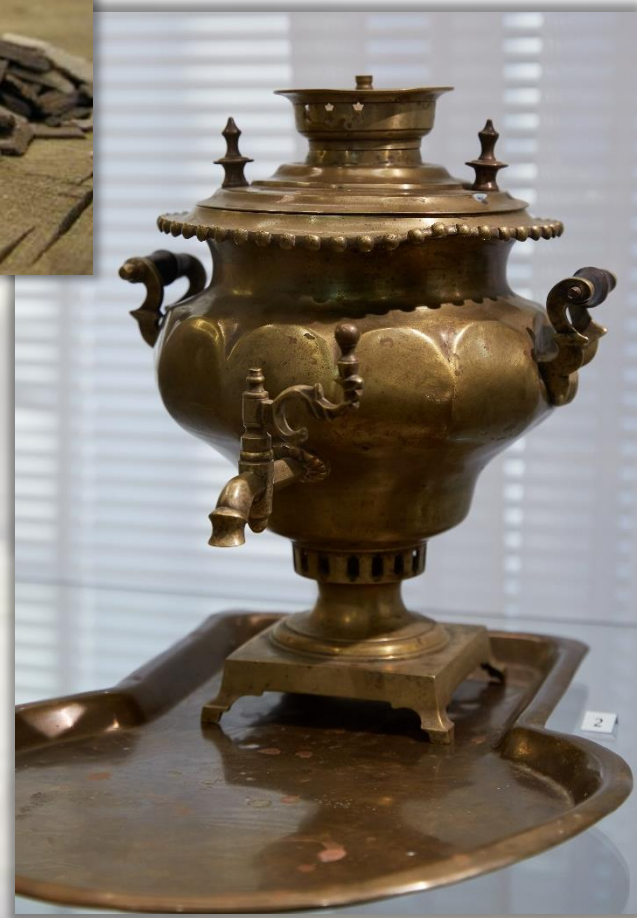
Самовар XIX в. г. Тула Медь. Литье, выколотка, токарная обработка

Самовар – сосуд для кипячения воды или, как его называли, «водогрейный сосуд» – стал символом русского чаепития. После наполнения резервуара водой, в жаровой кувшин (трубу) закладывали щепу и начинали растапливать самовар.