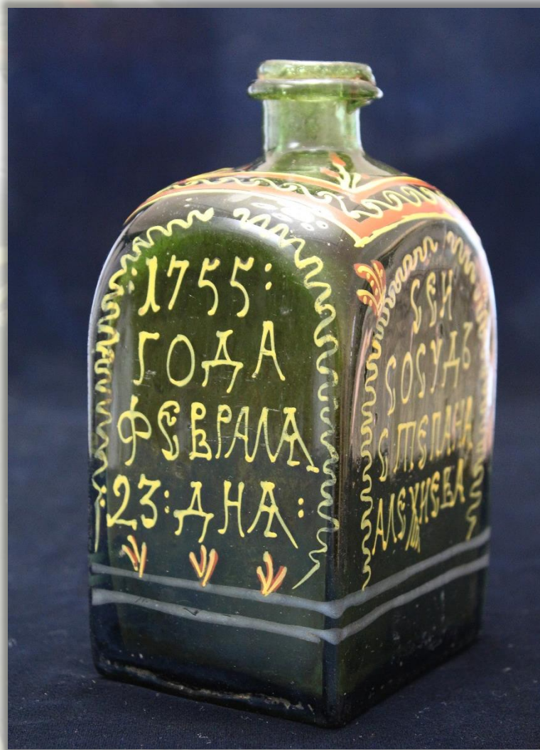
Полуштоф с эмалью 1755 г. Стекло цветное, эмаль Выдувание, роспись

В России изделия из стекла расписывались эмалями с середины XVII. Исключительную ценность таких эмалевых росписей составляет обилие надписей и дат.