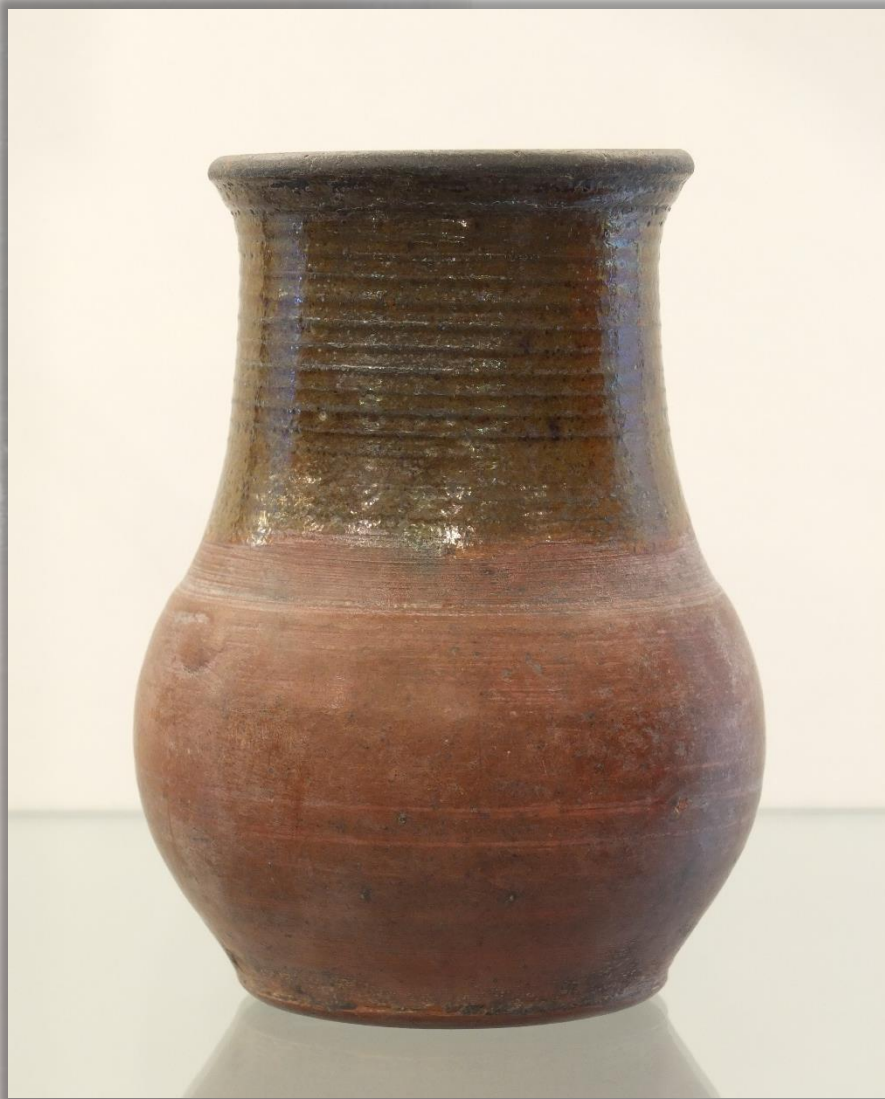
Кринка XIX в. Глина. Формовка, обжиг, глазурь

Форма кринки такова, что молоко в ней долго остаётся свежим, а при прокисании даёт толстый слой сметаны.