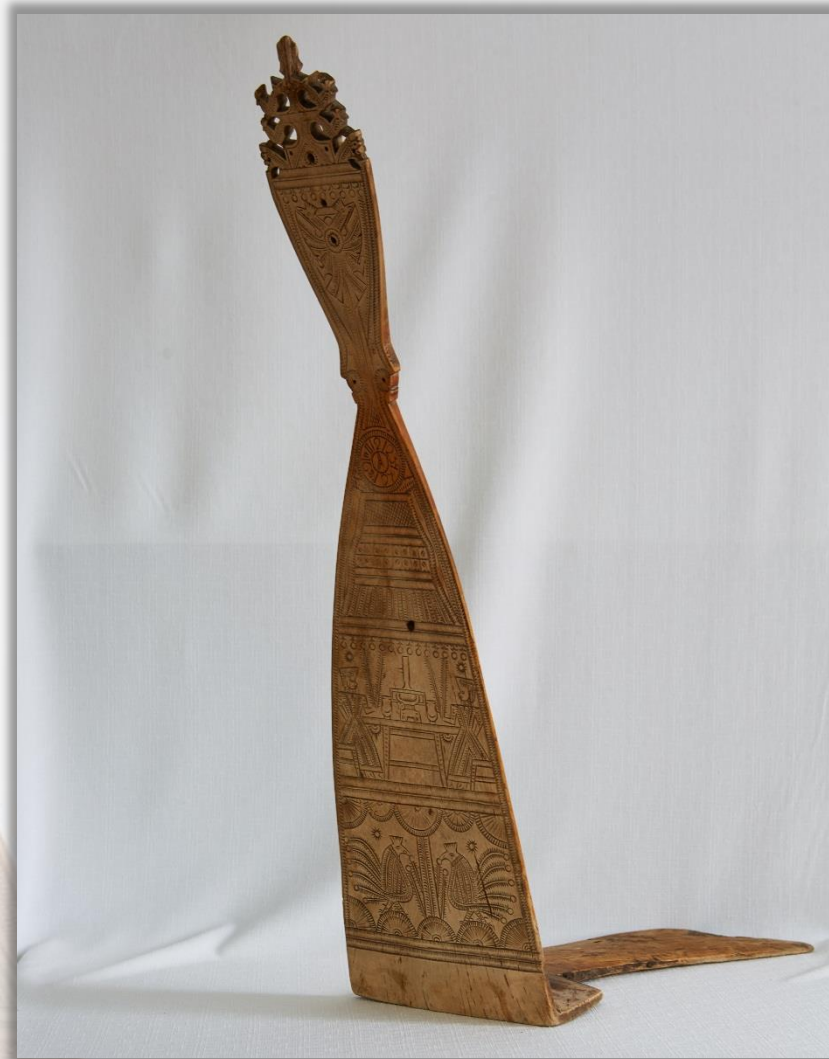
Прялка Перв. пол. XIX в. Ярославская губ., Даниловский уезд Дерево. Резьба

Прялка была постоянной принадлежностью быта русской крестьянки, считалась самым дорогим подарком, её хранили всю жизнь и передавали как память следующему поколению.