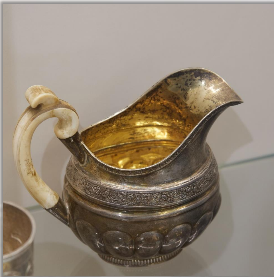
Молочник 1827 г. г. Санкт-Петербург Серебро, кость. Ковка, чеканка, золочение, пайка, резьба по кости