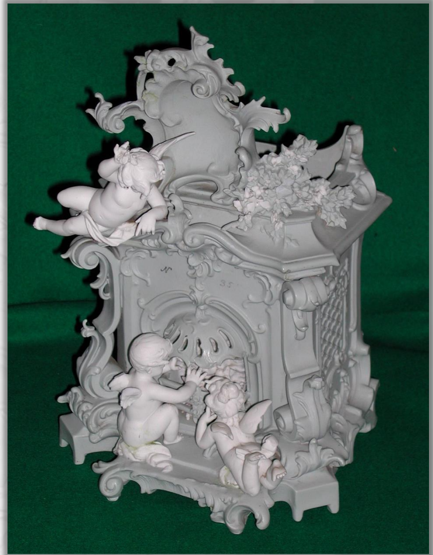
Ароматница XIX в.

Ароматическую смесь, изготовленную из различных плодов и растений, помещали внутрь вазы.