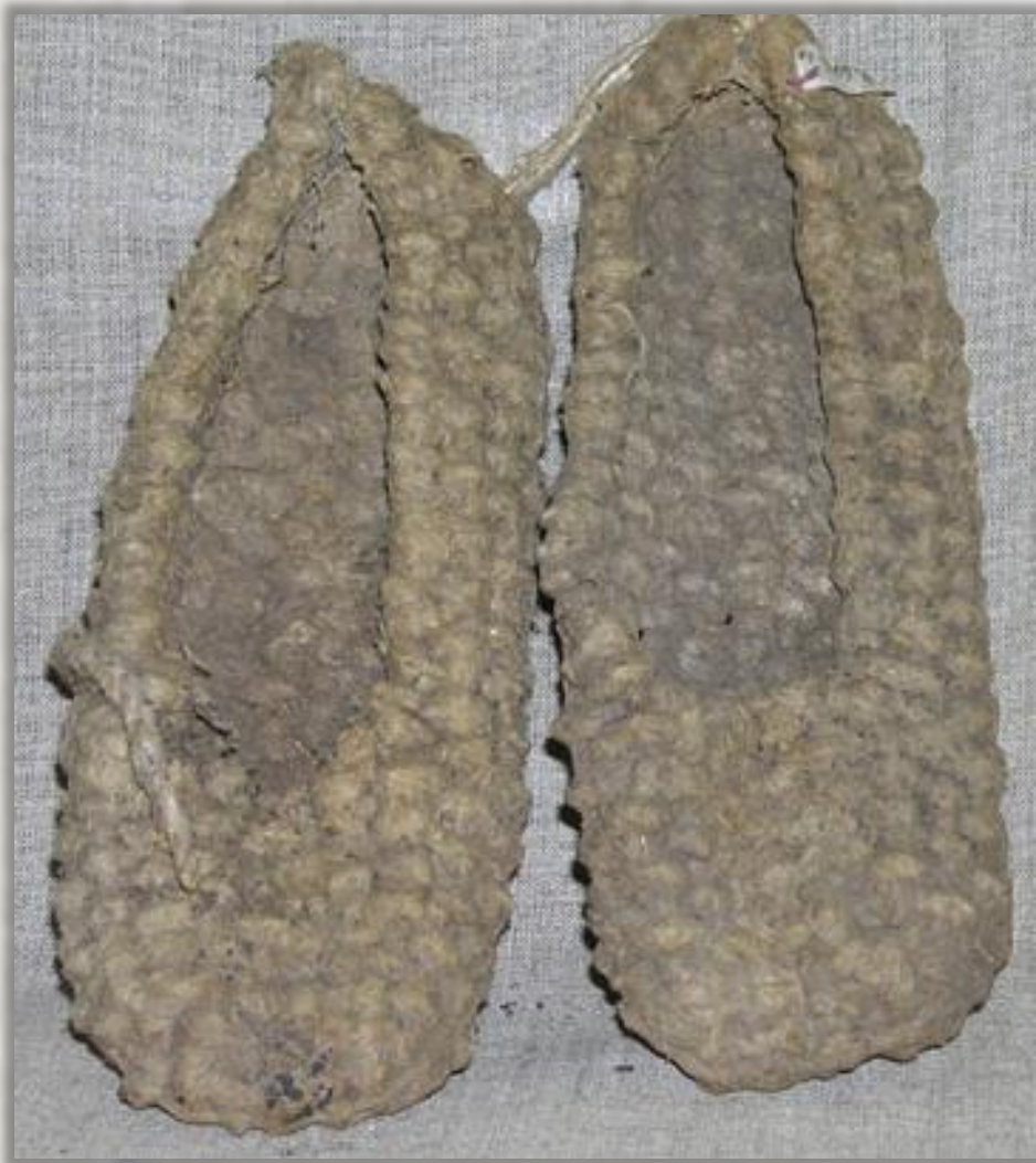
Лапотъ Нач. XX в. Верёвка льняная. Плетение

Лапотъ – это плетёная обувь из лыка или веревок, охватывающая ступню ноги со всех сторон. В Ярославской губернии были распространены лапти из пеньковых или льняных верёвок.