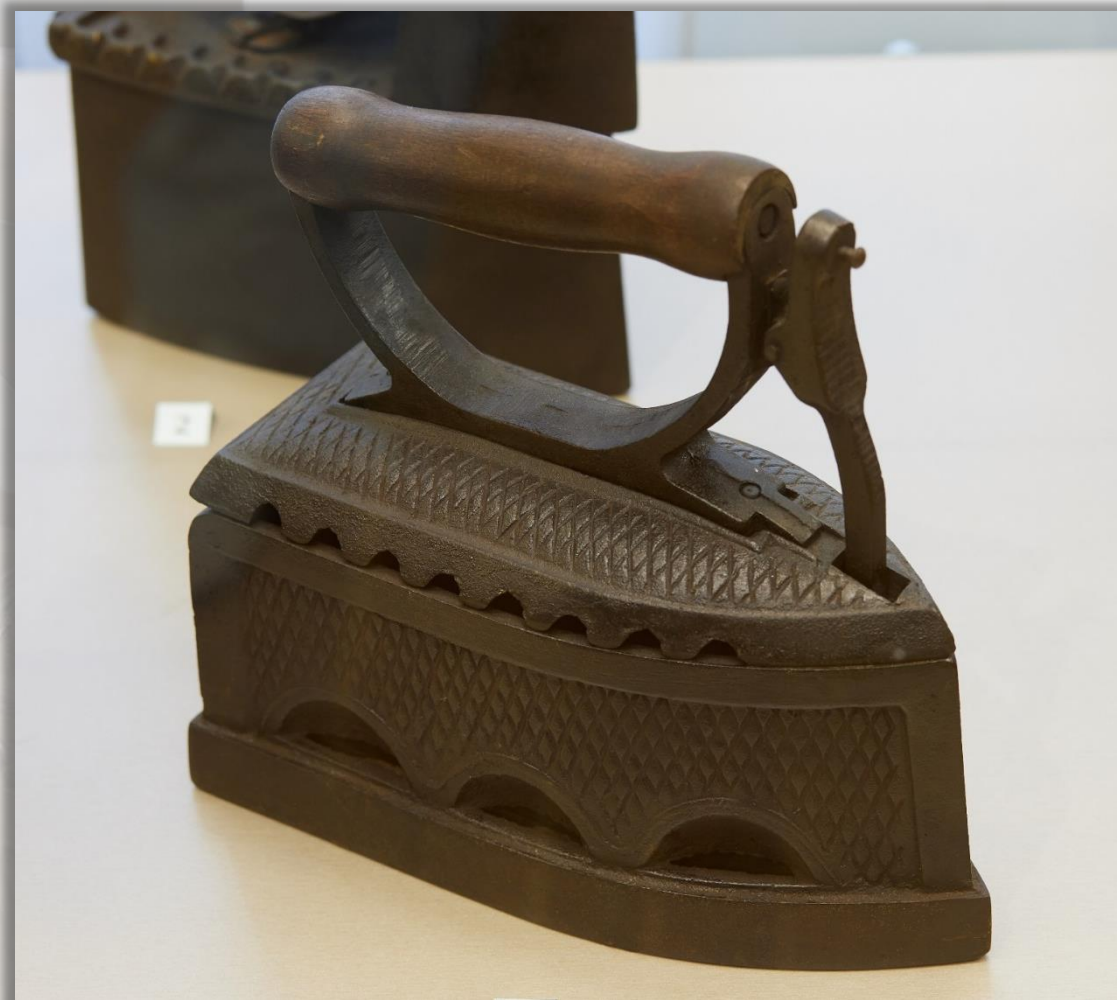
Утюг Кон. XIX в. Чугун, дерево. Литьё

Чугунные утюги – приборы для глаженья белья – начали отливать в XVIII веке на Демидовских заводах. Утюг нагревался за счёт помещаемых внутри углей или чугунной пластины.