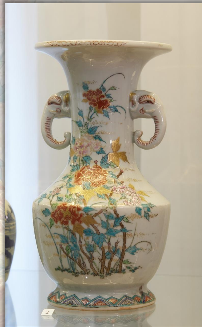
Ваза XIX в. Фарфор, краска, позолота Формовка, роспись, обжиг

Ваза – сосуд изящной формы с живописными или лепными украшениями. Вазы из различных материалов (фарфор, стекло, металл, мрамор) являются самым изысканным предметом декора и уже много веков играют важную роль в оформлении интерьера.