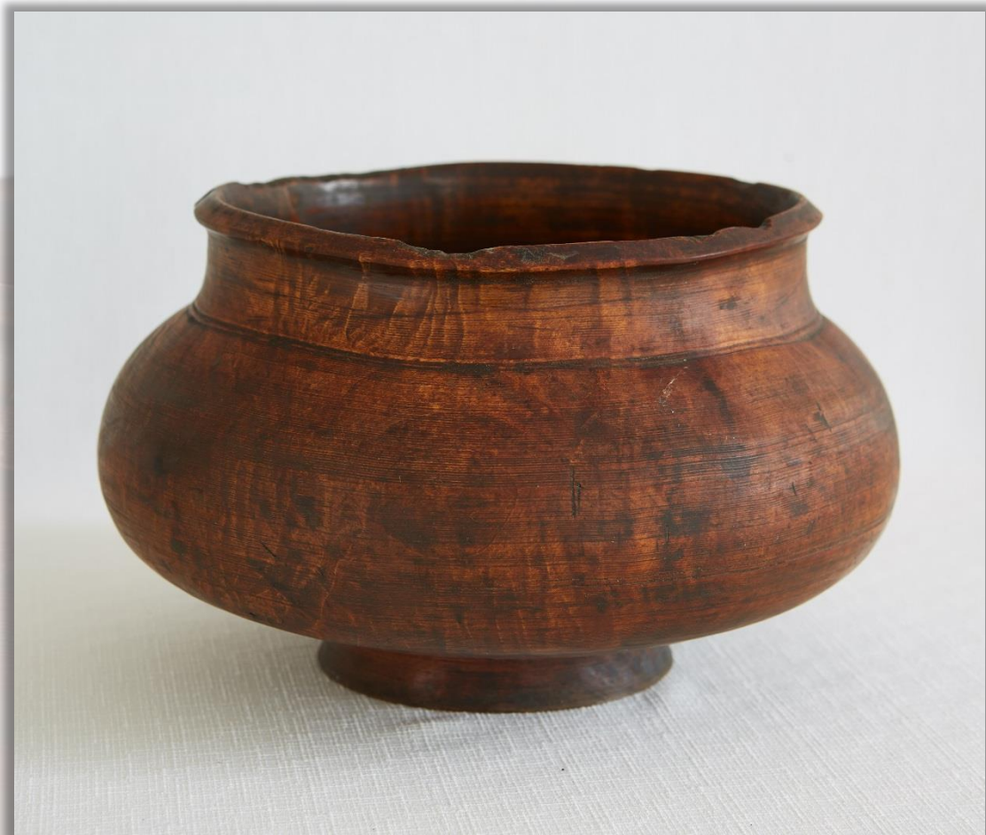
Братина берёзовая Кон. XVIII - XIX вв. Дерево. Токарная обработка

Название этого шарообразного сосуда происходит от слова «братчина» – праздничное застолье, во время которого братина передавалась по кругу, символизируя единение пирующих.