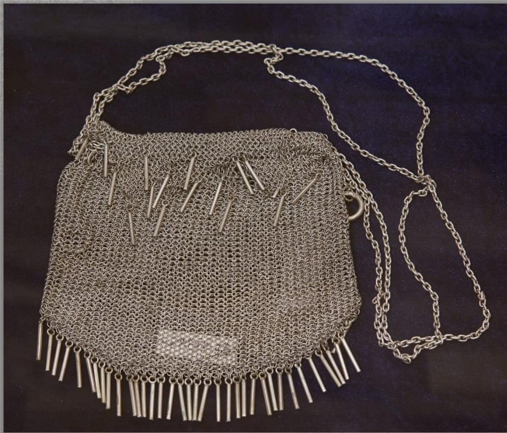
Ридикюль Кон. XIX - нач. XX вв. Серебро. Волочение, плетение кольчужное, пайка