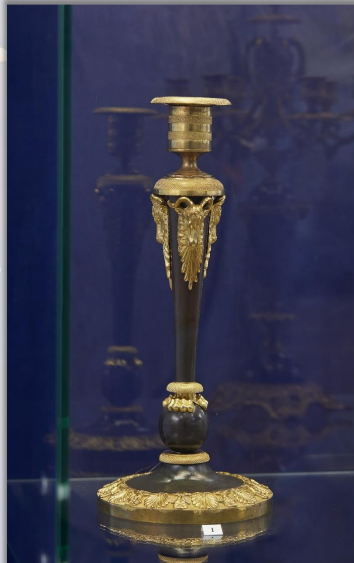
Подсвечник Перв. пол. XIX в. Бронза Литьё, штамповка, монтировка

Подсвечник – это подставка для одной или нескольких свечей. Вплоть до XVIII века подсвечники отливали из серебра, далее началась целая эпоха декоративнойковки из чёрных металлов (железо и сплавы) и литой бронзы. Внешний вид подсвечника менялся вместе с требованиями моды и легко подстраивался под любой стиль.