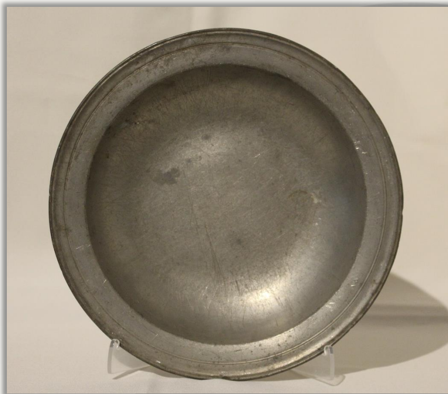
Тарелка Цеховой мастер: Антонов М. Кон. XVIII в. Олово. Литьё, точение