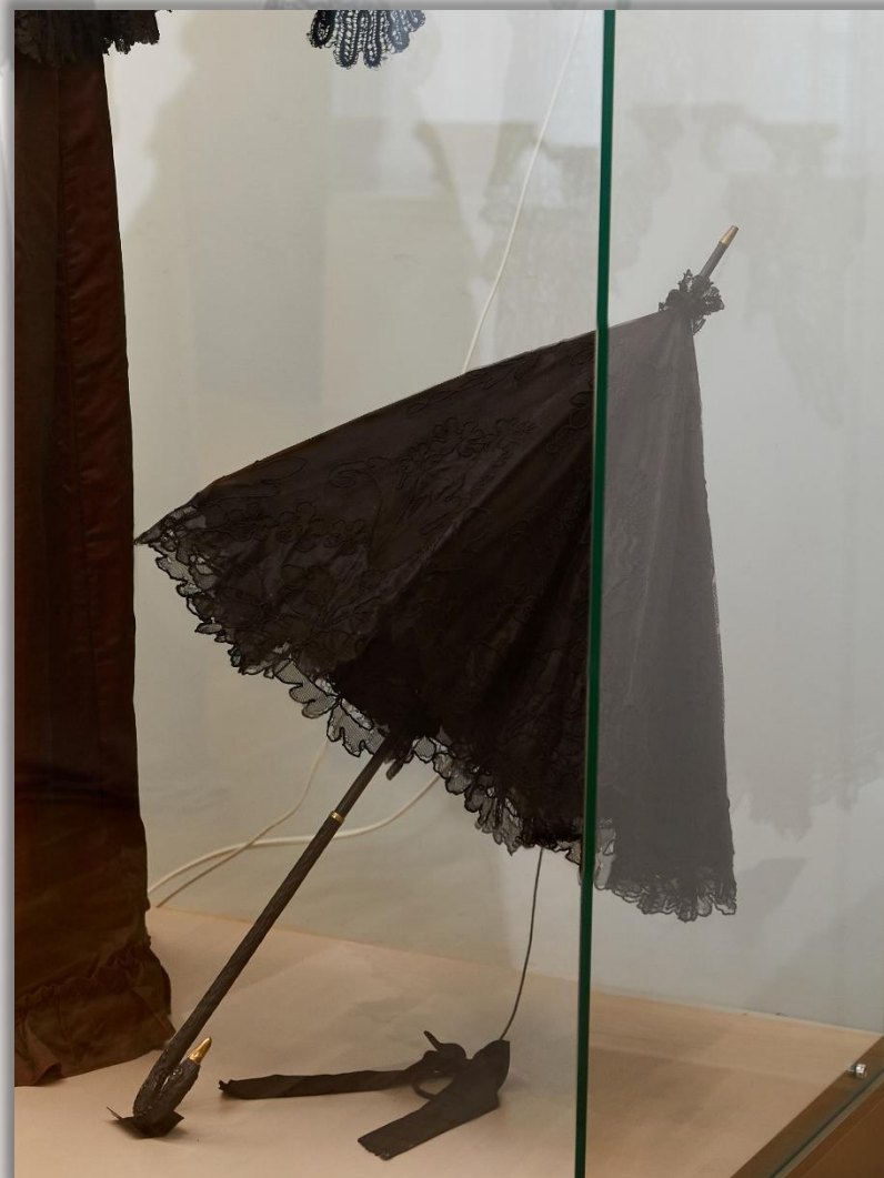
Зонт. XX в. Дерево, ткань

Зонт был неотъемлемой частью женского прогулочного наряда и использовался чаще как защита от солнца. Такие зонтики украшались вышивкой, кружевами, лентами, в то время как зонты от дождя были тёмного цвета и практически не имели декора.