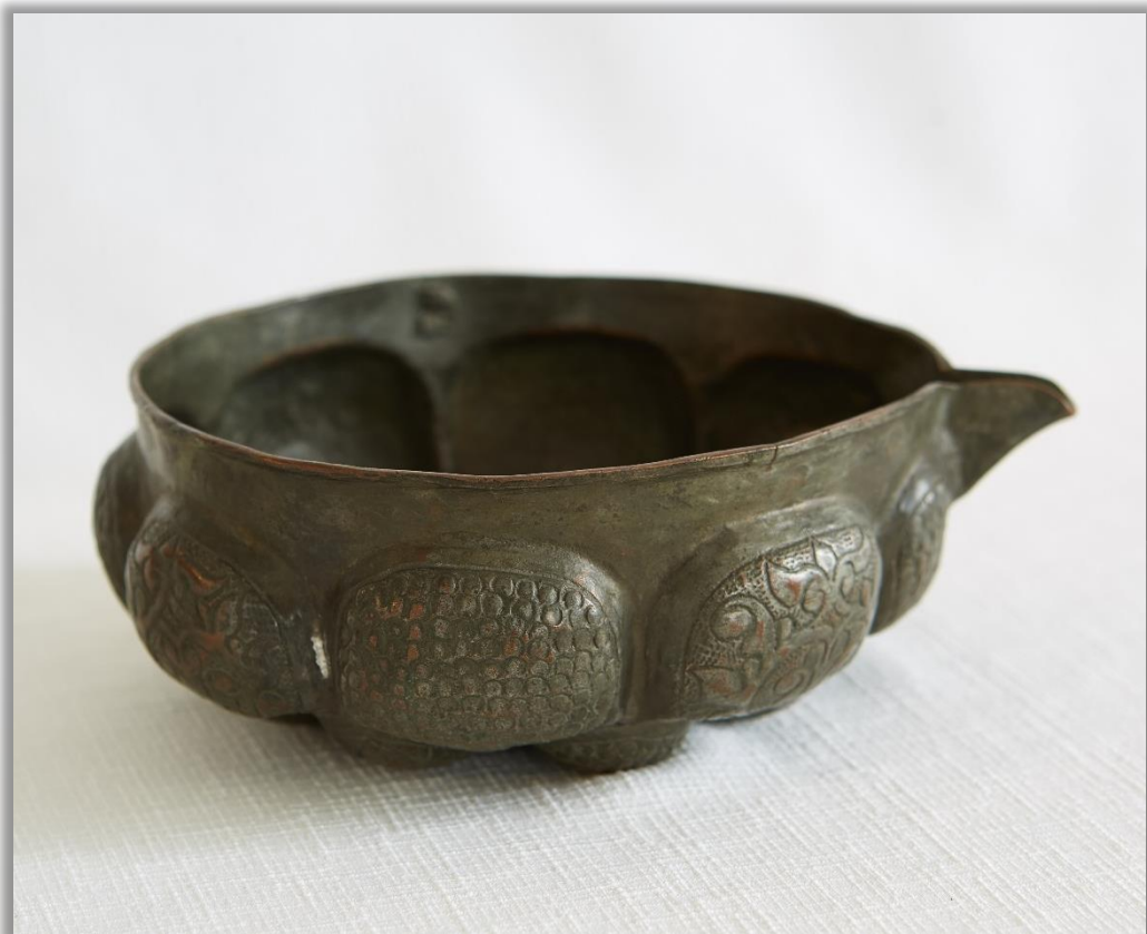
Ендова XVII в. Медь. Выколотка, чеканка, канфарение