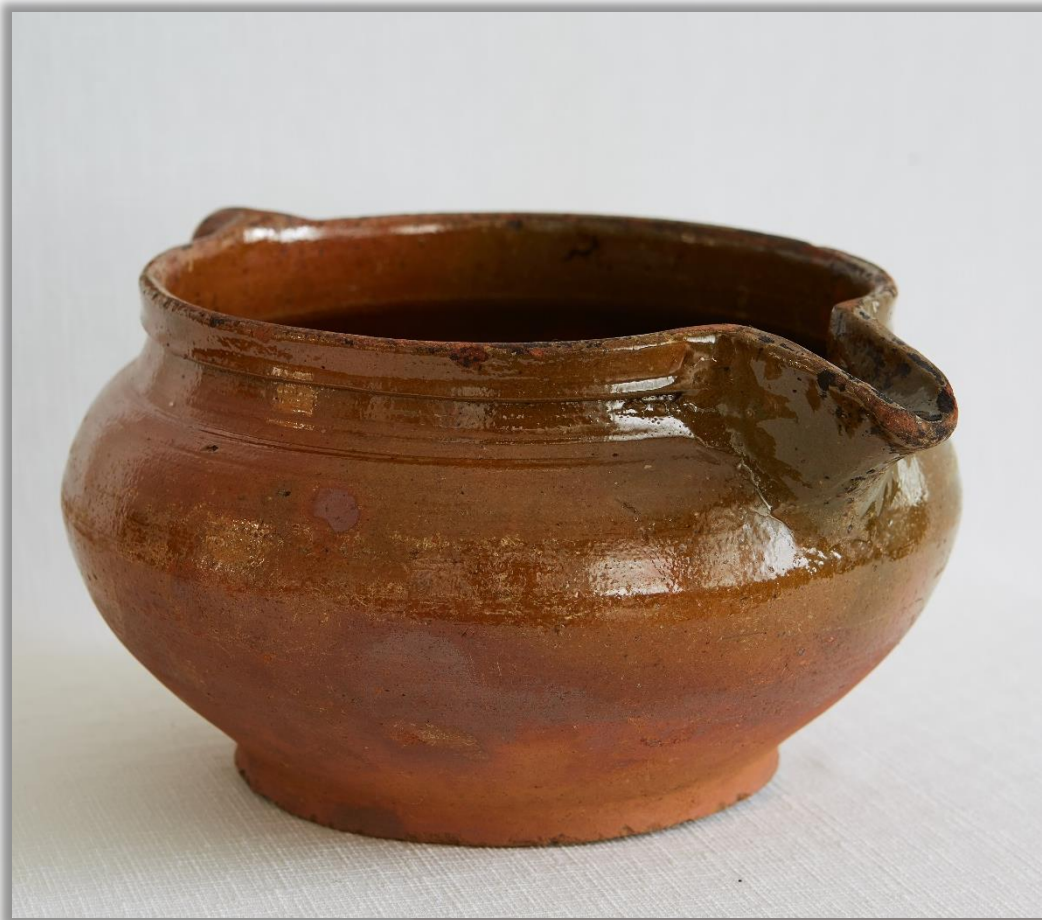
Горшок-истопник XIX в. Глина. Формовка, обжиг, глазурь