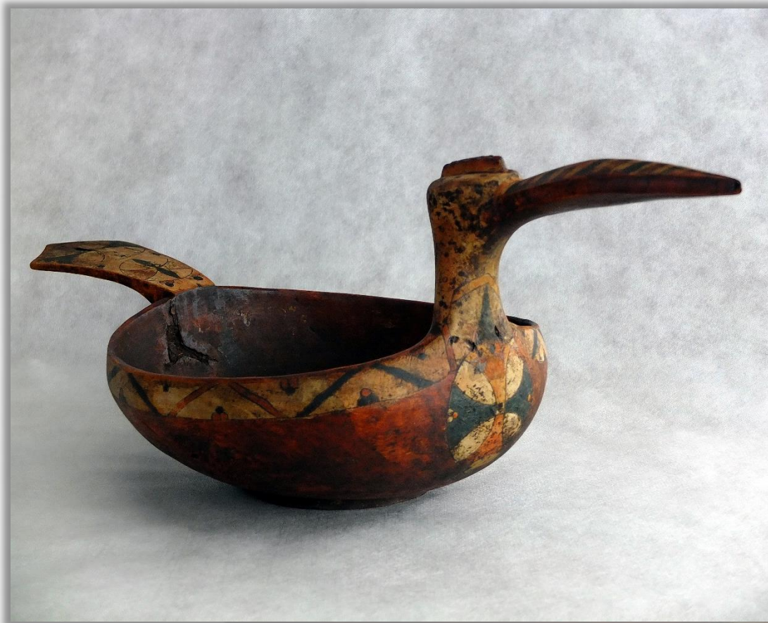
Скобкар XIX в. Дерево. Долбление, резьба, роспись