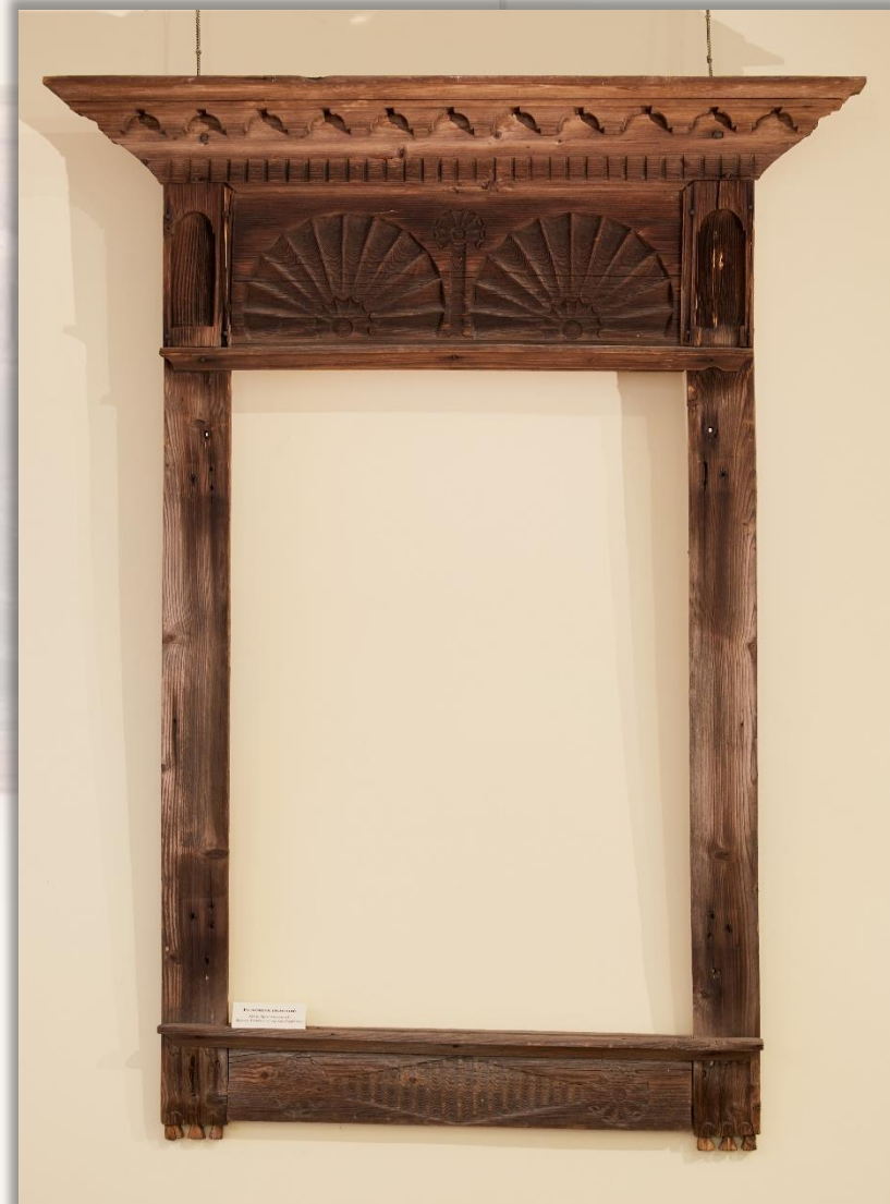
Наличник XIX в. Ярославская губ. Дерево. Резьба, столярная обработка

Наличники с глухой резьбой бытовали в Угличе с конца XVIII века и до последней трети XIX столетия. На их орнаментацию оказали влияние с одной стороны, элементы классического стиля, с другой – традиции народной резьбы.