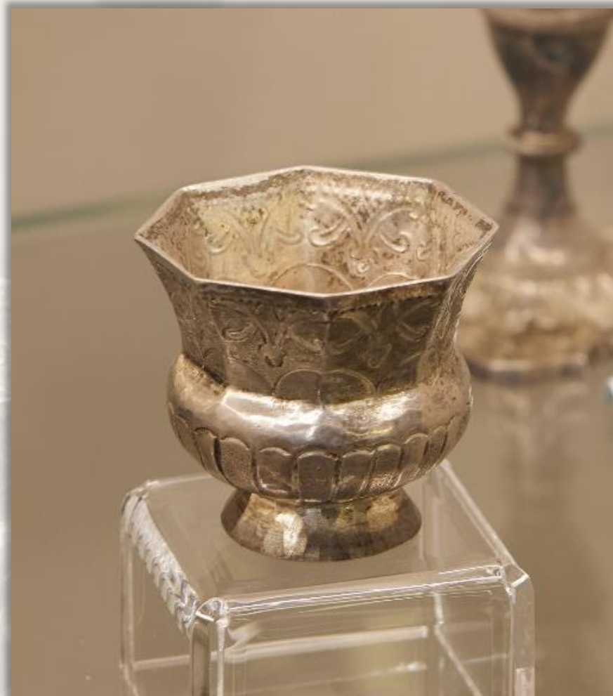
Чарка Нач. XVIII в. г. Москва Серебро Чеканка, гравировка, пайка

Чарка – небольшой сосуд для питья крепких напитков – особенно распространена была в XVII-XVIII вв. Форма чарки разнообразна: в виде опрокинутого колпачка, в виде овальной или круглой чашечки, с ручкой или без ручки.