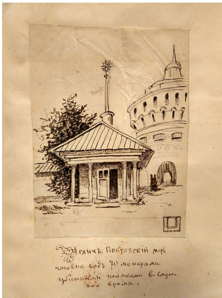
Углич. Покровский монастырь. Часовня над 70 монахами убиненными поляками в Смутное время. Ф. 796 Оп. 2 Ед. хр. 70. «Свое и от людей», Т.2.