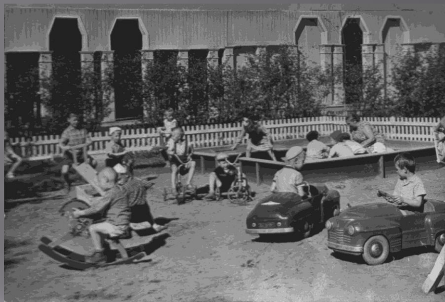
Детский сад в г. Угличе Пионерский лагерь «Юность»