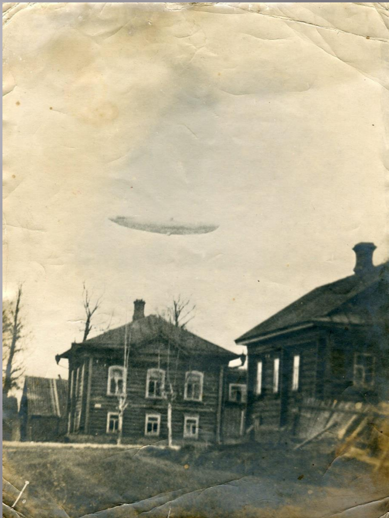
Углич 20-е годы В небе –дирижабль

Жизнь небольшого города после революции, конечно, изменилась. Причудливо соединялись, казалось бы несовместимые вещи: классные дамы из прошлого и революционные программы в школе, крестные ходы и коммунистические субботники. Впервые для детей стали продумывать досуг