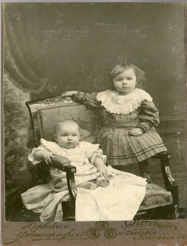
Фотографии, сделанные в мастерской А.Н. Русяева г. Углича