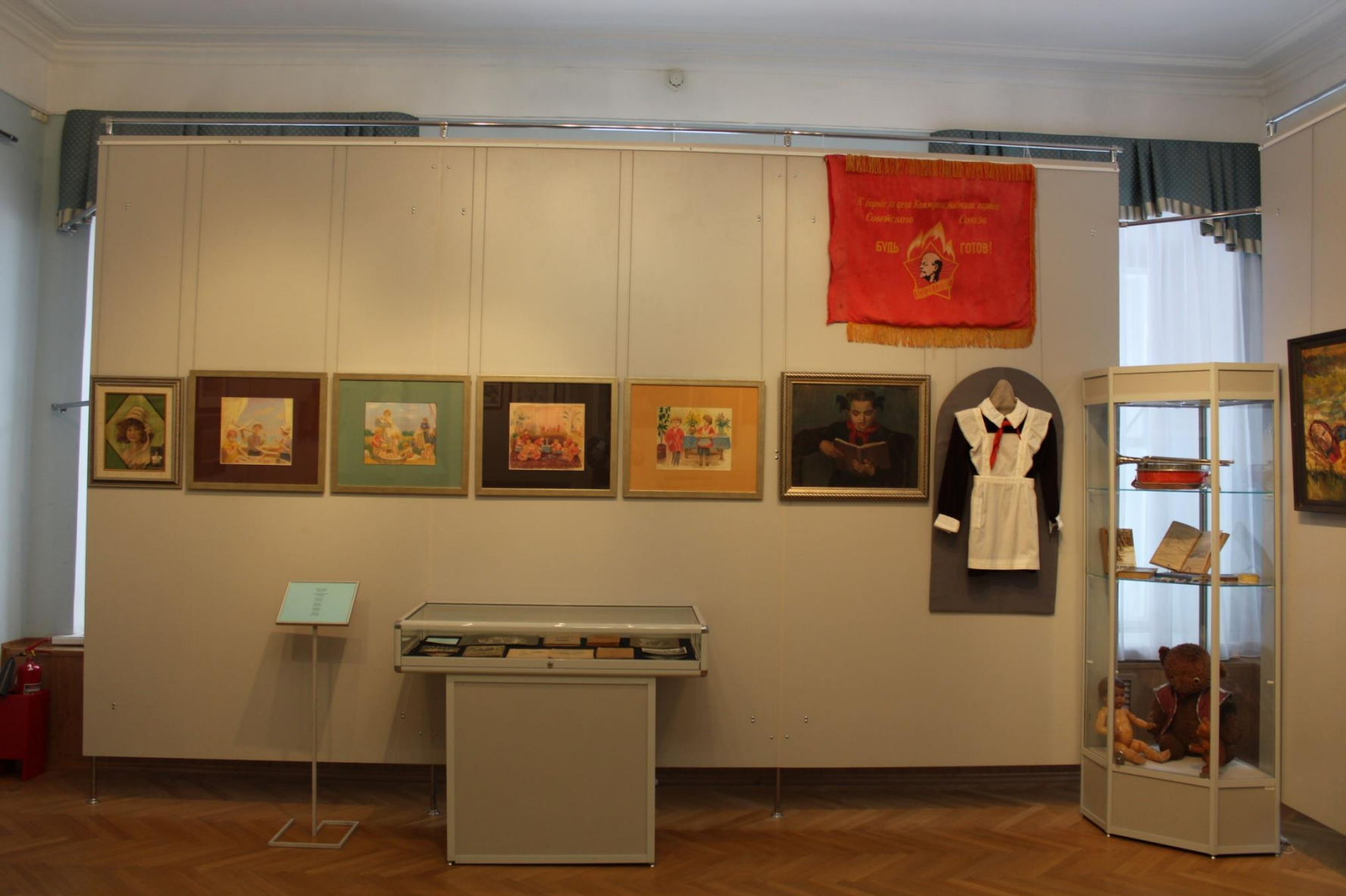
Рисунки 20-х гг., пастель (из коллекции галереи «Союз Творчество») Знамя и пионерская форма (из коллекции УгЖАХМ)