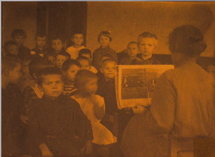
Фото 20-х гг. из коллекции УЗНАХМ)