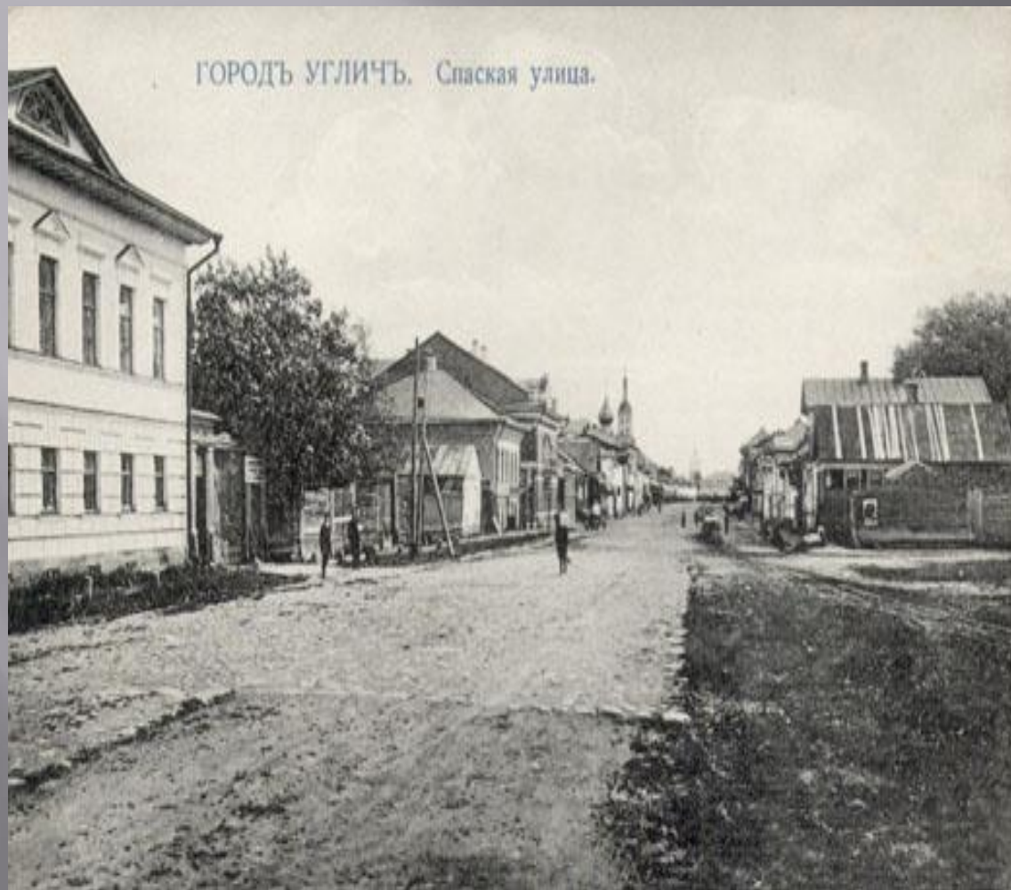
ГОРОДЪ УГЛИЧЬ. Спаская улица.