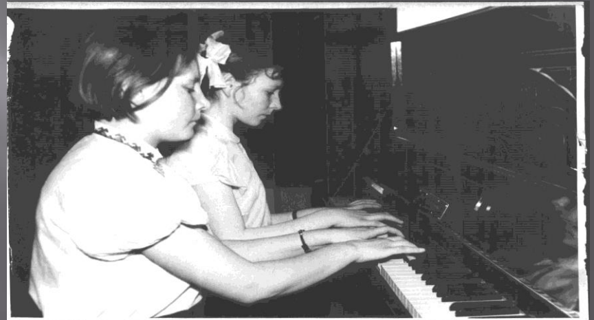
Игра в 4 руки.