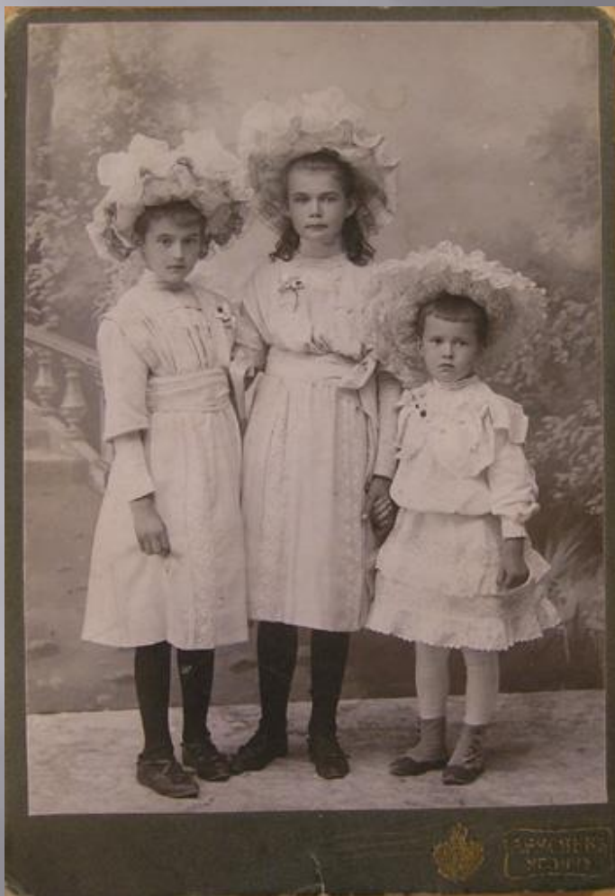
Девочки из семьи Опариных