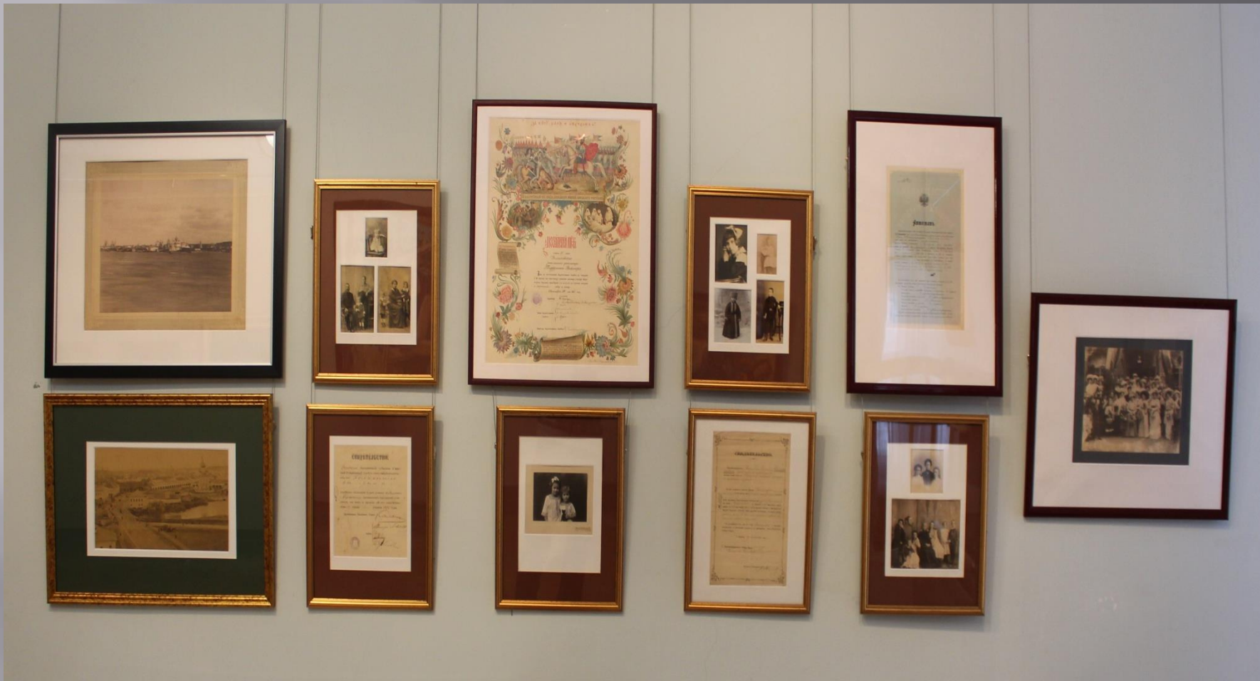
фотографии и документы угличских семей Суриных, Евреиновых, Теддерсон