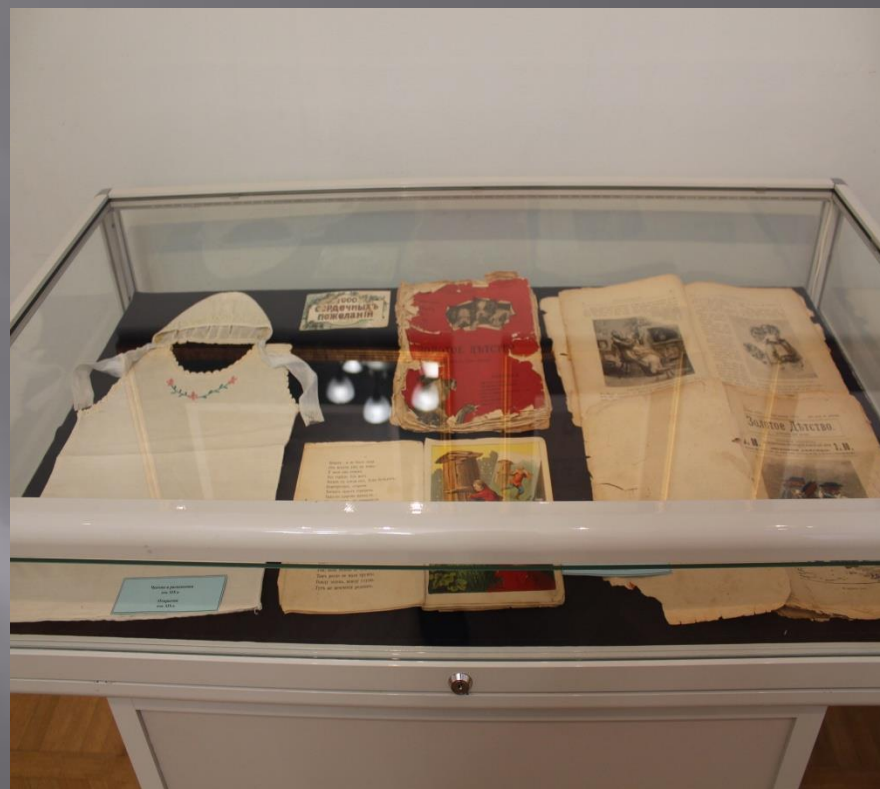
Коляска, свидетельства о рождении, первые детские книжки и журналы (из коллекции УГИАХМ)